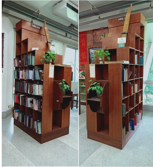
ชั้นหนังสือรูปแคน

การนำแคนไปประยุกต์ใช้ในศูนย์สารนิเทศอีสานสิรินธร โดยทำตู้วางหนังสือหรือชั้นวางหนังสือให้มีรูปทรงคล้ายแคน แต่ใช้วัสดุที่เป็นไม้เนื้อแข็งนั้น ทำให้ประโยชน์ใช้สอยของตู้ หรือชั้นหนังสือมีคุณค่าทางความงามเพิ่มขึ้น ทำให้บรรยากาศของห้องสมุดมีสีสันไม่น่าเบื่อ