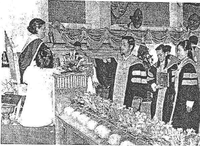
สมเด็จพระเทพรัตนราชสุดาฯ สยามบรมราชกุมารี เสด็จฯ แทนพระองค์ ไปพระราชทานปริญญาบัตรแก่ผู้สำเร็จการศึกษาจากมหาวิทยาลัยมหาสารคาม ประจำปีการศึกษา ๒๕๔๙-๒๕๕๐ ณ อาคารพลศึกษา มหาวิทยาลัยมหาสารคาม อำเภอกันทรวิชัย จังหวัดมหาสารคาม